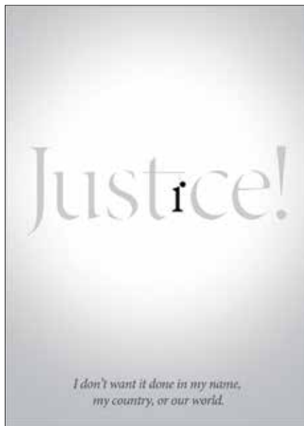
Selcuk Ozis, Grande Bretagne

L'objectif de cette séance va être d'observer la manière dont les différents graphistes ont joué avec la typographie pour illustrer une problématique liée à l'application de la peine de mort dans le monde.